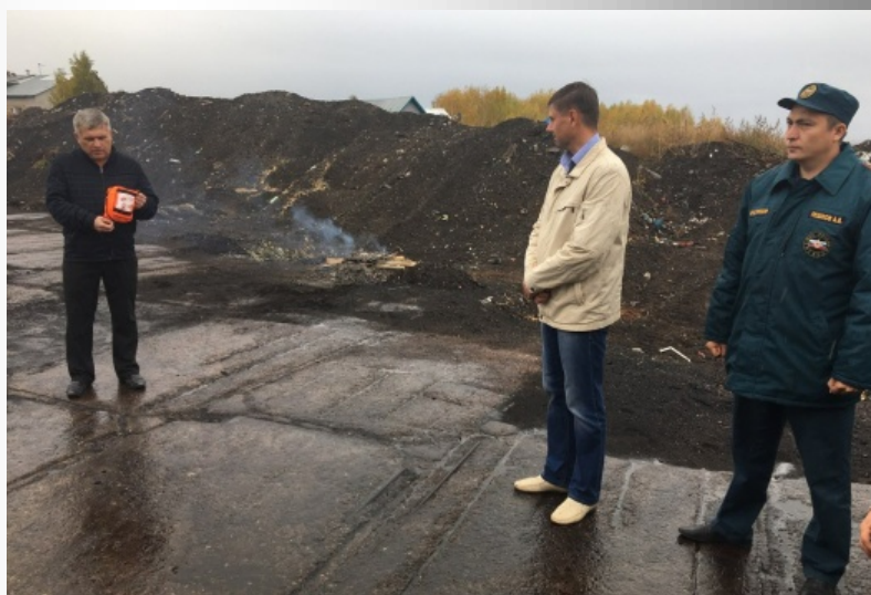
Старший инспектор ОНД и ПР по г.Канску и Канскому району