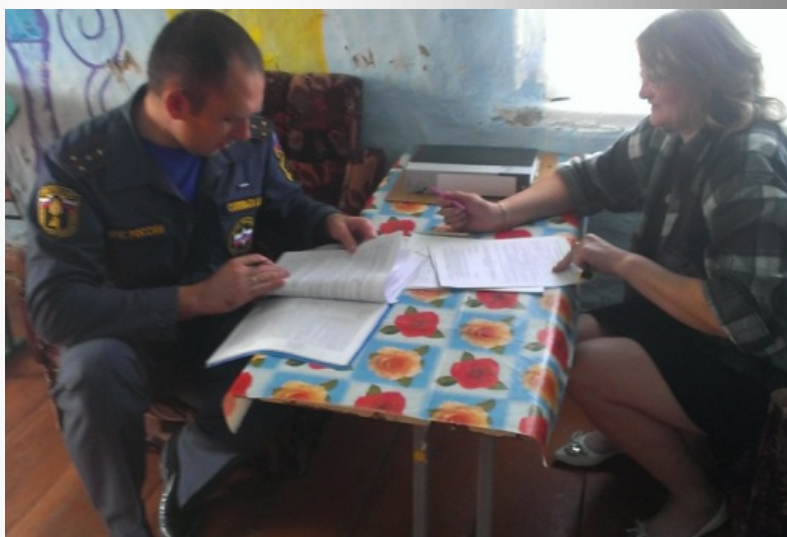
Старший инспектор ОНД и ПР по г.Канску и Канскому району